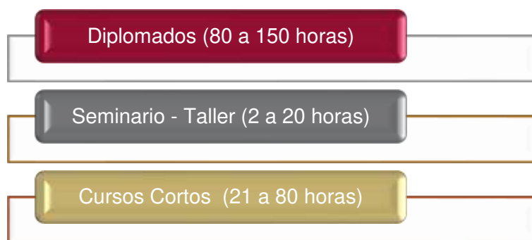
Modalidades de Educación Continua

SEMINARIOS O TALLERES: Programas académicos de carácter teórico - práctico que tienen por objeto la actualización de profesionales, el desarrollo de habilidades y el fortalecimiento de competencias, por lo general se enmarcan en el desarrollo de temas coyunturales. Tienen una duración máxima de 20 horas. Son de carácter presencial, semipresencial o virtual. Se otorga certificado de asistencia al cumplir con el 80% de las horas programadas.